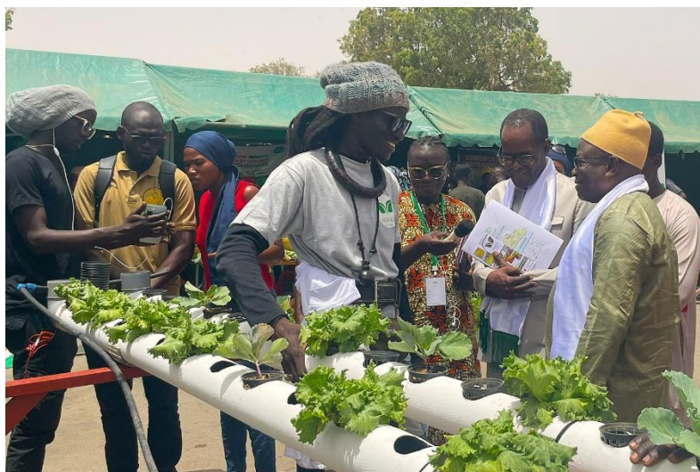
Figure 10 : Visite de l'initiative du GIE DER GI - Agro

Dans la région de Thiès, les trois départements ont organisé des étapes parallèles. A Thiès , la Direction de l'horticulture du MASAE, le DRDR, l'adjoint au Maire et la DyTAEL de Thiès, ont accueilli les 127 participants dont 54 femmes, issus de 64 organisations très diverses, en notant une forte mobilisation de la presse. Après les salutations institutionnelles et la présentation des objectifs et enjeux de la caravane, la journée s'est poursuivie avec une représentation théâtrale, la visite de la foire-exposition consacrée aux produits et initiatives agroécologiques, et une tournée à travers la ville pour sensibiliser les populations, avec un passage au marché, au lycée, et une rencontre avec le Cadre De Reflexion Et D'action Sur Le Foncier Au Senegal (CRAFS) réuni ce même jour en AG. Le lendemain, les participants ont échangé sur les enjeux autour de la transition agroécologique dans le département de Thiès et sur la formulation de recommandations concrètes issues de la zone pour la Stratégie nationale d'agroécologie.