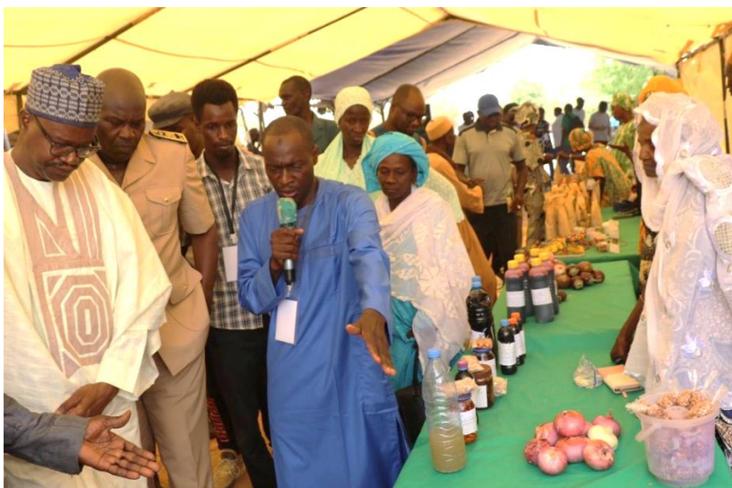
Figure 9 : visite de la foire avec le maire de Guédé Village et le Préfet de Podor

journée s'est terminée par l'organisation de la 1ère édition de la foire des produits agroécologiques du département de Podor. Le préfet et l'ensemble des participants ont pu faire le tour des stands de produits pastoraux, céréaliers, agro forestiers, maraichers, et laitiers, tenus par une soixantaine d'exposants. Enfin le dernier jour, des visites parallèles de sept