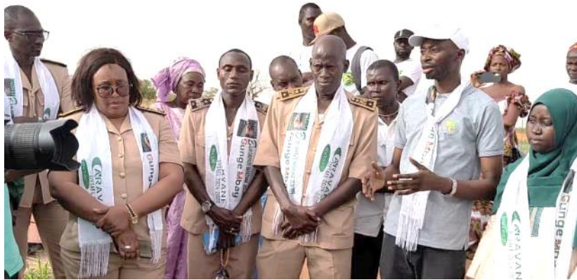
Figure 8 : Le Directeur de l'horticulture (casquette blanche) et les autorités locales

petits acteurs privés locaux (GIE). Un programme très riche les a rassemblés pendant toute une journée, avec la visite du périmètre maraîcher agroécologique du village de Ida Gadiaga d'une superficie de 20 ha, espace d'expérimentation pour le développement de la filière horticole oignon et pomme de terre ; puis le partage des résultats des expérimentations menées dans ce périmètre autour de la production agroécologique d'oignon et de pomme de terres , et une exposition de la production ; la présentation de la DyTAES et de ses actions à l'échelle nationale ; des partage d'expériences avec les acteurs de la DyTAEL de Foundiougne et la mise en place d'un comité ad hoc pour poursuivre la cartographie des acteurs et actrices de l'agroécologie du département de