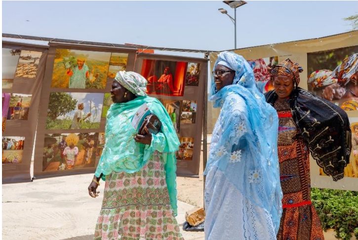
Figure 11 : L'exposition Yaay Dund installée au niveau de l'étape de Mboro

issues de 41 structures, principalement des organisations paysannes et associations locales. Les participants ont échangé sur les enjeux autour de la transition agroécologique dans le département de Tivaouane, et sur la formulation de recommandations concrètes issues de la zone pour la Stratégie nationale d'agroécologie. L'exposition photographique « YAAY DUND - Régénérer le vivant » a également été installée sur place et visitée par le