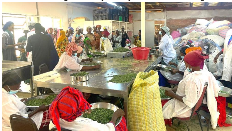
Figure 12 : Unité de transformation de nebeday, Mbacke Kadior

Dans le département de Kébemer , les principaux acteurs de l'agroécologie se sont réunis à Mbacke Kadior, sur le site de l'ONG des villageois de Ndem. 95 personnes ont participé à cette étape, dont 72 femmes, majoritairement des productrices de la zone engagées dans l'agroécologie. La journée a été consacrée à la visite de périmètres maraichers agroécologiques, d'un jardin de production de semences, d'unités de transformation d'huile de neem, de moringa, bissap, bouye, ... Des échanges ont également été organisés sur les enjeux autour de la transition agroécologique dans le département de Kébemer et sur la formulation de recommandations en lien avec les problématiques du territoire, pour alimenter la Stratégie nationale d'agroécologie.