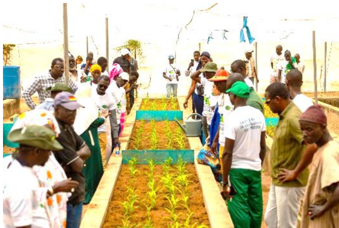
Figure 6 : Unité de production d'inoculum

A Bambey , la caravane a été accueillie par le préfet et la toute jeune DyTAEL locale pour deux journées riches en échanges. 73 personnes dont 24 femmes issues de 36 organisations étaient présentes à cette étape, avec en particulier des organisations