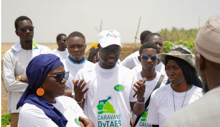
Figure 15 : Le DG de l'ANCAR entouré des participants à la caravane, à l'étape de Saint Louis

caravane, en parallèle des étapes d'Oussouye, Vélingara et Médina Yoro Foula. 75 personnes ont participé à cette étape (dont 37 % de femmes), issues de 34 organisations, principalement des organisations paysannes et association locales, et des instituts de recherche de formation. 06 sites ont été visités : exposition photo sur les changements climatiques, centre artisanal écologique de formation sur les écoconstructions en typhas, périmètres maraichers agroécologiques, pépinière communautaire, ferme école agroécologique, Parc national de la Langue de Barbarie. Les participants ont également travaillé sur les enjeux autour de la transition agroécologique dans le département, et sur