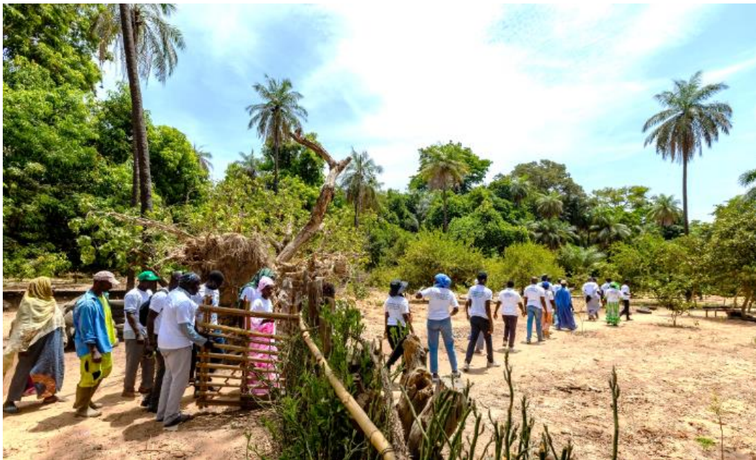
Figure 1 : Visite de site lors de l'étape de Bignona