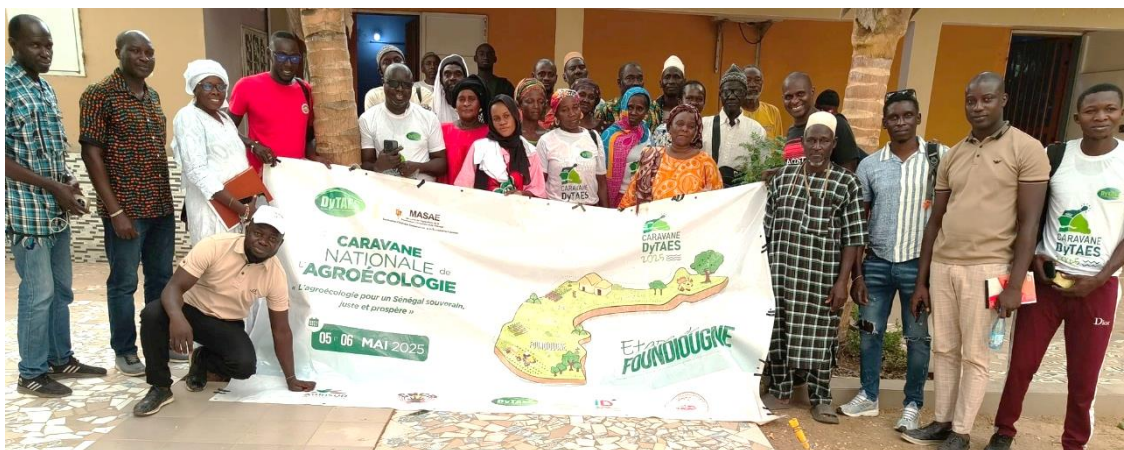
Figure 4 : les participants à l'étape de Foundiougne

A Foundiougne , 50 personnes dont 12 femmes ont répondu à l'appel de la DyTAEL, issues principalement d'organisations paysannes et associations locales. Lors de la première journée, des visites de terrain ont été organisées en parallèle dans trois zones (Djilor, Dioundi, Toubacouta), avec au total 9 initiatives visitées : unités de compostage, parcelles agricoles, production de bio-stimulants, centre de formation, etc. Le lendemain, la DyTAEL et ses partenaires ont échangé sur les activités de la DyTAES, sur les enjeux autour de la mise à l'échelle de l'agroécologie, et des propositions pour la Stratégie nationale ont été formulées.