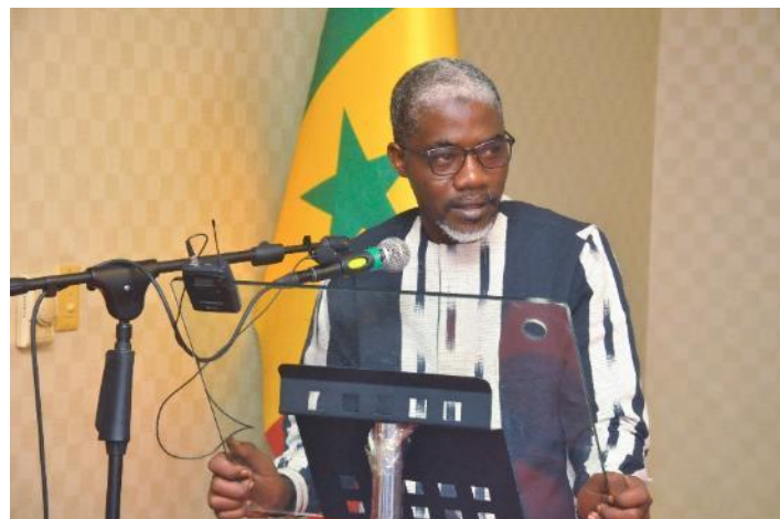
Figure 18 : Intervention du Secrétaire d'Etat aux coopératives et à l'encadrement paysan