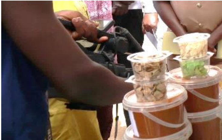
Figure 3 ; la foire de l'étape de Fatick

locales, et un groupe important de journalistes. Le premier jour, un convoi coordonné par la DyTAEL, regroupant l'ensemble des participants, a visité cinq initiatives répartie dans tout le département : un site de recherche agro-sylvo-pastoral, une boulangerie utilisant des céréales locales, un GIE féminin combinant pisciculture et maraîchage, un champ maraîcher agroécologique, et la