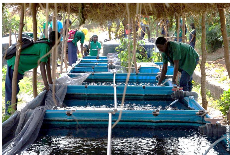
Figure 13 : Pisciculture au lycée agricole de Bignona

Dans le département de Bignona , région de Ziguinchor, le préfet de Bignona, le sous-préfet de Tenghory, les Maires de Bignona, Tenghory et Balingore, et la DyTAEL de Bignona ont accueilli la caravane de l'agroécologie pendant 2 jours, en parallèle de l'étape de Rufisque. 87 personnes ont participé à cette étape, dont 33 femmes, issues de 52 structures, principalement des organisations paysannes, associations locales, et petits acteurs privés locaux (GIE). Les participant.e.s ont visité 8 initiatives agroécologiques : périmètres maraîchers, fermes intégrées, unités de transformation, ferme école agroécologique, lycée agricole. Le lendemain, ils et elles ont échangé sur les enjeux autour de la transition agroécologique dans le département de Bignona et ont travaillé sur la formulation de recommandations en lien avec les problématiques de leur territoire, pour