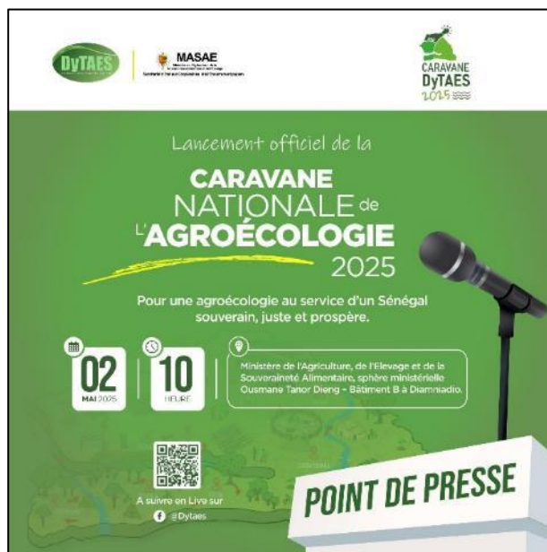
Figure 2 : Visuel du lancement officiel de la caravane

Le vendredi 02 mai a lieu le lancement de la 3 e édition de la caravane de l'agroécologie, à la Sphère ministérielle de Diamniadio, dans les locaux du Ministère de l'Agriculture, de la Souveraineté alimentaire et de l'Élevage du Sénégal (MASAE), avec le directeur de cabinet du Secrétaire d'Etat aux coopératives et à l'encadrement paysan, des agents du MASAE et les acteurs de la DyTAES. Ce fut l'occasion de présenter à la presse et aux participants le contexte et les objectifs de la caravane.