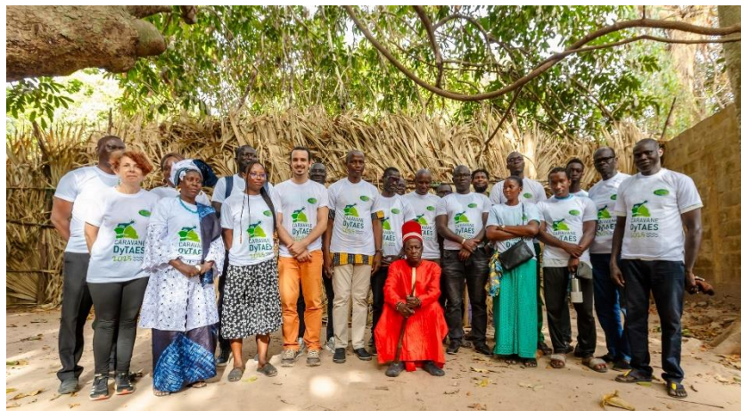
Figure 14 : Une partie des participants entourant le Roi d'Oussouye

Les premières réflexions pour la mise en place d'une DyTAEL ont également été organisées. Enfin, l'exposition photographique « YAAY DUND - Régénérer le vivant » a été installée sur place et visitée par le Préfet et l'ensemble des participant.e.s.