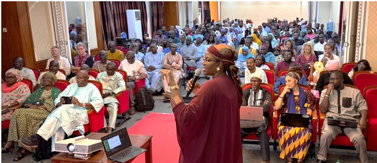
Figure 17 : Atelier de restitution de la caravane, Dakar, sept 2025