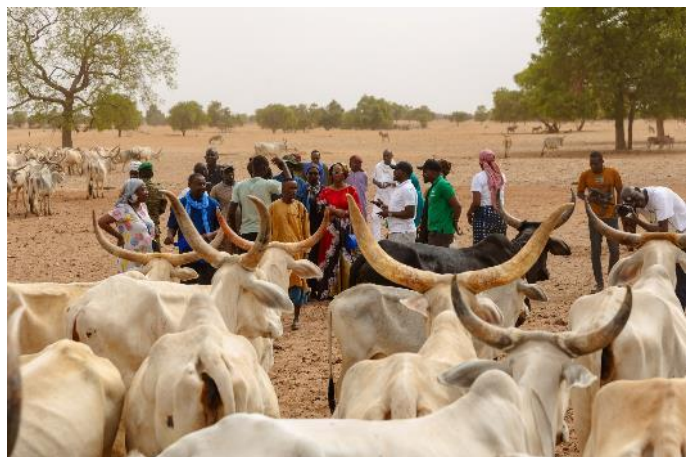
Figure 7 : visite du ranch de Dolly lors de l'étape de Linguère

Dans le département de Linguère (Louga), le Préfet et la DyTAEL de Linguère ont accueilli la caravane de l'agroécologie pendant deux jours, avec 41 participants dont 8 femmes, issus de 25 organisations (principalement des acteurs individuels, et des organisations paysannes et associations locales). L'étape a commencé par une journée d'échanges sur les enjeux autour de la transition agroécologique dans le département de Linguère et sur son intégration dans les politiques locales et nationales, avec la formulation de recommandations concrètes issues de la zone agro sylvo pastorale, pour la Stratégie nationale d'agroécologie. L'exposition « YAAY DUND - Régénérer le vivant » également installée sur cette étape a été visitée par le Préfet et l'ensemble des participant.e.s. Le lendemain, les participants se sont rendus au Ranch Djibo Leyti KA de Dolly, pour échanger avec les éleveurs, chefs de village, services techniques et l'équipe du Ranch sur le plan de gestion du Ranch, la gouvernance des ressources naturelles, la préservation de l'environnement, les conflits agriculteurs - éleveurs, les cultures fourragères, et la valorisation du fumier dans la production agricole au sein du ranch.