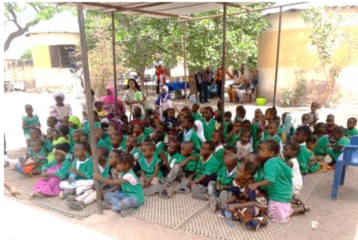
Figure 5 : les enfants de la case des tout-petits de Saré Guilèle

A Tambacounda , les membres et partenaires de la DyTAEL ont répondu à la convocation officielle du Préfet ! Ce sont au total 99 personnes dont 29 femmes, issues de 57 organisations, qui ont fait le déplacement. Une grande diversité d'acteurs était présent, et notamment une belle représentation des élus et autorités locales. Après une rencontre avec l'adjointe au maire de Tambacounda, les participant.e.s sont allés à la découverte de trois initiatives agroécologiques : grenier communautaire de la case des tout-petits de Saré Guilèle, et échanges autour du consommateur local, périmètre maraîcher agroécologique et unité de tri et de valorisation des déchets de la mairie de Tambacounda, et ferme école intégrée de l'ONG mine verte